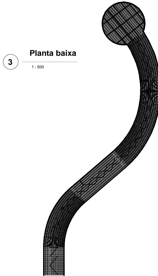
3 Planta baixa 1 : 500